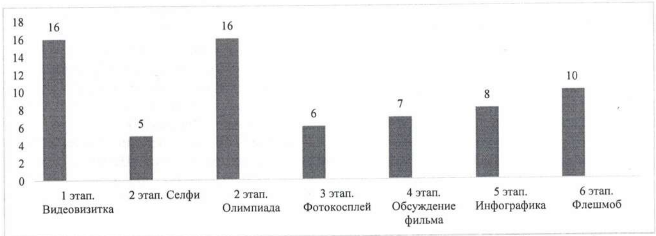
Диаграмма «Мониторинг включенности участников по этапам online-площадки «Мы вместе!»