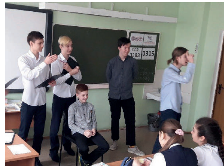
Проект «Командообразование», волонтеры 9-го класса работают с 5-м классом.

Потенциальные волонтеры готовят свое краткое резюме (заполняют готовую анкету), ищут волонтерские вакансии, предлагают свои услуги.