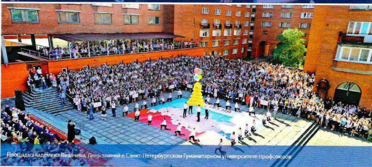
Площадь академика Лихачева, День знаний в Санкт-Петербургском Гуманитарном университете профсоюзов